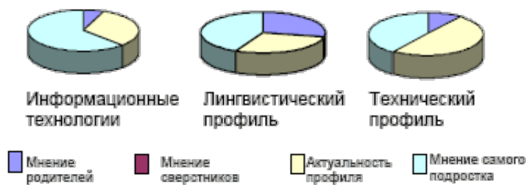
Рис. 1. Мотивация выбора профиля обучения.

профиля обучения (рис. 1). Нами было выявлено, что на мнение родителей при выборе профиля обучения в большей степени опирались учащиеся по лингвистическому профилю (37,5%), чем учащиеся по другим профилям. Актуальность профиля влияла на выбор в большей степени у учащихся по техническому профилю (55,6%), а собственным мнением руководствовались подростки, учащиеся по профилю «информационные технологии» (71,4%).