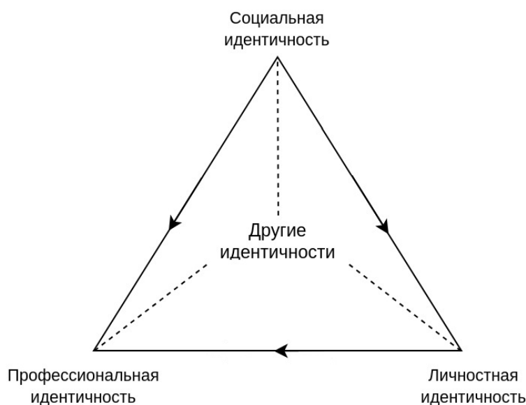
Рис. 1: Соотношение профессиональной идентичности с остальными разновидностями идентичностей.