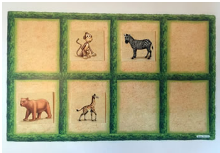
Рис. 2. Пример задания из субтеста «Зоопарк».

В субтесте «Зоопарк» от ребенка требуется запомнить местоположение карточек с изображениями животных. Экспериментатор размещает одну или несколько карточек на план «зоопарка» и просит ребенка запомнить расположение. Затем картинки убираются, и ребенка просят самостоятельно разместить их в тех ячейках, в которых они находились до этого (см. рис. 2). Картинки с животными демонстрируются в «клетках» зоопарка в течение короткого периода времени. Усложнение задания происходит за счет возрастания количества карточек и «клеток».