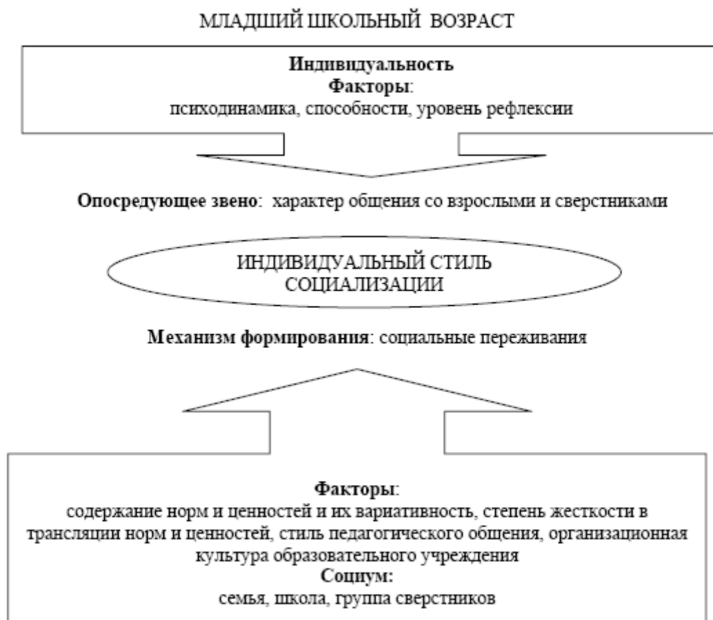
Рис. 2. Модель формирования индивидуального стиля социализации у детей и подростков: младший школьный возраст.