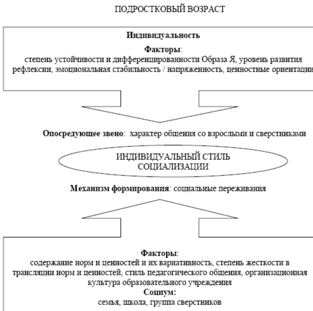
Рис. 3. Модель формирования индивидуального стиля социализации у детей и подростков: подростковый возраст.