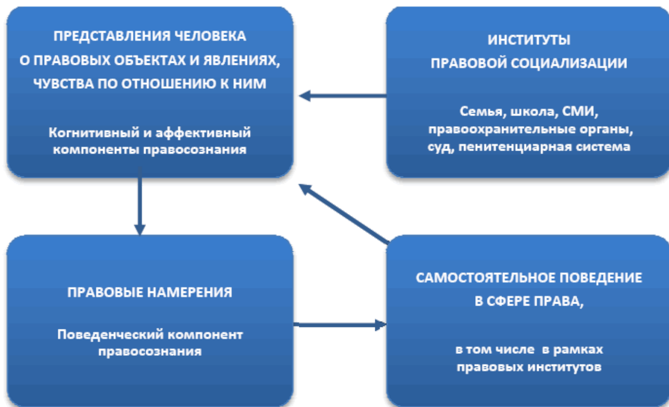
Рис. 2. Подходы к изучению правосознания.